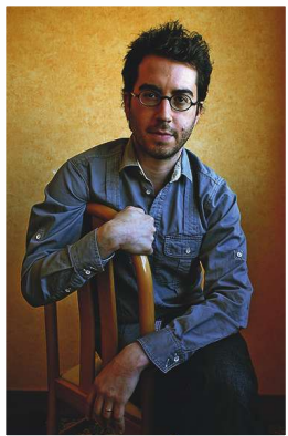
Jonathan Safran Foer. In alto: Gabriel García Márquez. Nell'altra pagina: Maurizio Maggiani

Confortati dalle notizie Usa dove il mercato del libro elettronico non ha eroso quello tradizionale, gli editori italiani hanno vinto le loro paure: «L'offerta sarà di sette-ottomila titoli scaricabili entro Natale. La previsione è quella di un mercato che arriverà a coprire, entro dicembre, l'1,5 per ▶